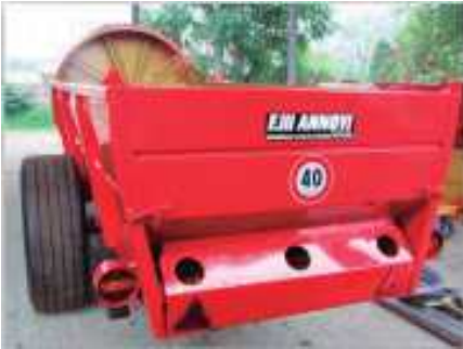
KIT DE LUCES