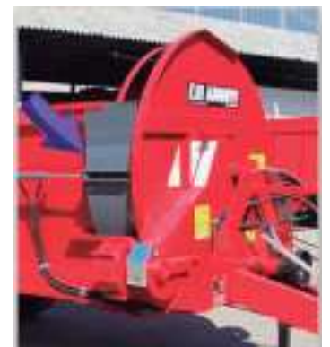
PUERTA LATERAL HIDRÁULICA.