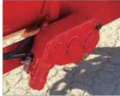
TRANSPORTADOR HIDRÁULICO DE CADENA CON VELOCIDAD AJUSTABLE + VALVULA ANTISHOCK