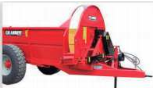
CONJUNTO DE FRENOS MECÁNICO + HIDRÁULICO NEUMÁTICO