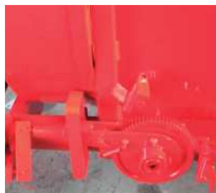
TRANSPORTADOR DE CADENAS MECÁNICO CON 3 VELOCIDADES.