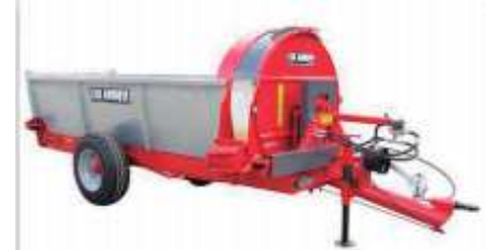
GALVANIZACIÓN EN CALIENTE DE PAREDES LATERALES Y PUERTA TRASERA