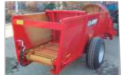
PUERTA TRASERA QUE AVANZA EMPUJANDO ESTIÉRCOL A LA TURBINA MOVIDA POR CADENAS, PARA ESTIÉRCOL MUY HÚMEDO