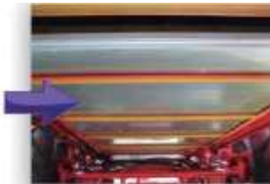
DOBLE FONDO DE LA LÁMINA GALVANIZADA BAJO LAS CADENAS