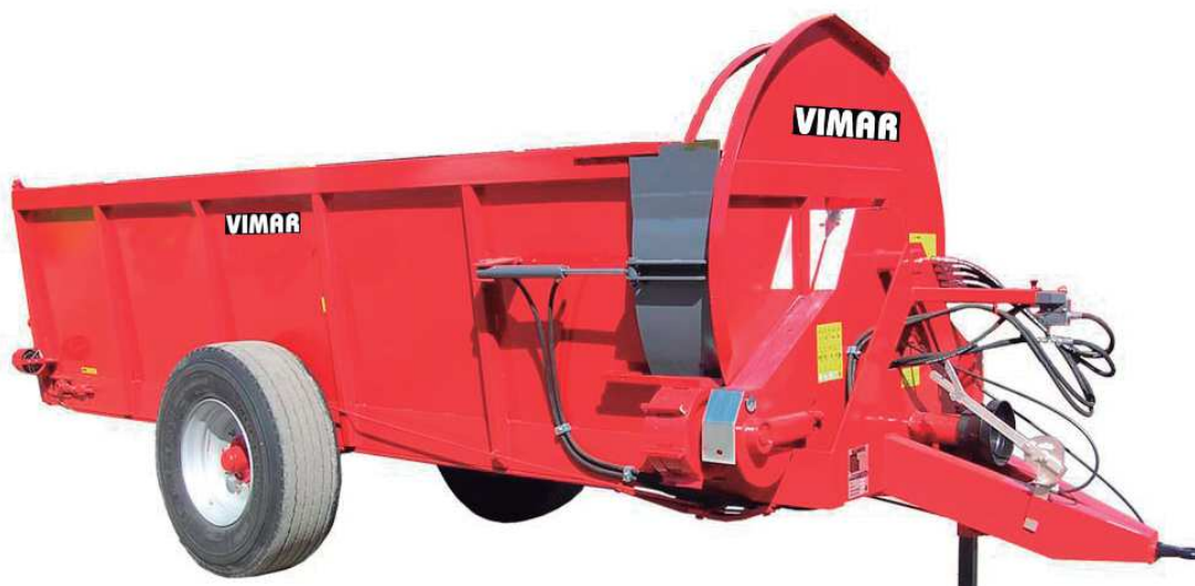
Foto con rodillo lateral estandar