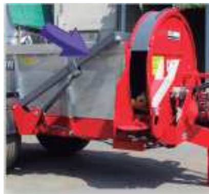
PUERTA HIDRÁULICA DELANTERA